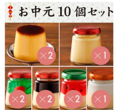
【お中元】コンプリート10個セット

商品名：【お中元】コンプリート10個セット（プリン6種10個入／5,000円） 内容量：カップdeレトロプリン2個、なめらかプリン1個、メロンソーダプリン2個、 コーヒープリン2個、夏の王様すいかプリン2個、生杏仁プリン1個