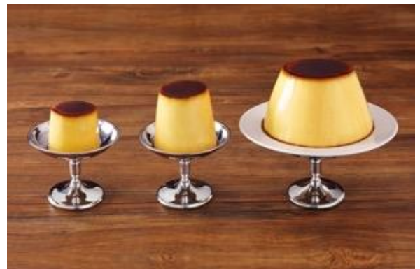
(左)レトロプリン (中央)レトロプリン大 (右)レトロプリン特大

オンラインショップ： https://i-love-pudding.shop-pro.jp/